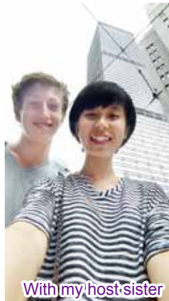
With my host sister