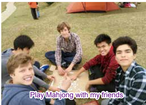
Play Mahjong with my friends