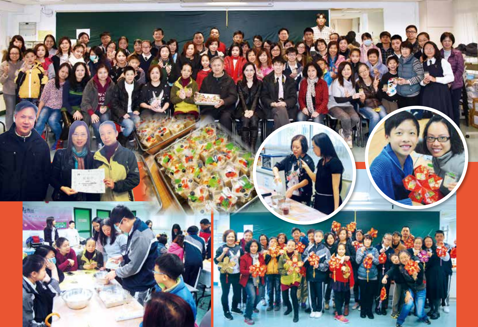
● 紅草梅乳酪慕絲蛋糕及利是封吊飾製作班1月16日（星期六）