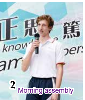
2 Morning assembly