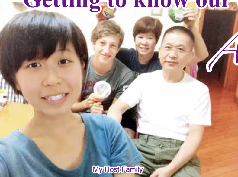
My Host Family