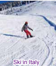
Ski in Italy

There are so many different things but at the same time there are still so many similarities to my home country. The people look different; the food is different; the buildings are different. But at the same time, I can still speak to the people, they can understand me. With many different things, I can learn a lot of new things. Learn about a new culture, a new language, and get to know a lot of many new people. I think exchange programs are very important because exchange programs help people to learn understanding people from different countries and cultures. When the people on this planet are able to understand one another there is a smaller chance that conflicts will occur. So if we want to live in a peaceful world, we first have to learn to understand one another. And that is what exchange programs stimulate.