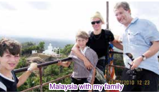
Malaysia with my family